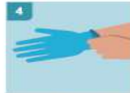
4 ESTÍRE HASTA COLOCAR EL PRIMER GUANTE