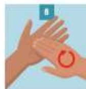
8 LÁVESE LAS YEMAS Y UÑAS DE LOS DEDOS