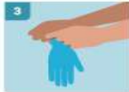
3 TOCAR SOLO LA SUPERFICIE CORRESPONDIENTE A LA MUÑECA