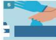
5 RETIRE EL SEGUNDO GUANTE PARA REPETIR EL PROCEDIMIENTO