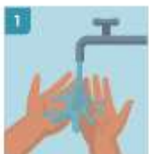
1 MÓJESE LAS MANOS