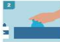
2 DESINFECTARSE LAS MANOS ANTES DE COGER LOS GUANTES