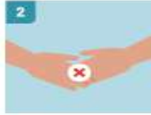
2 EVITAR TODO SALUDO QUE IMPLIQUE CONTACTO FÍSICO