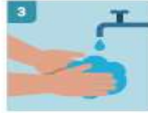
3 LAVADO DE MANOS FRECUENTE