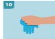
10 INMEDIATAMENTE DESECHE LOS GUANTES EN UN CUBO CERRADO SIN TOCAR EL EXTERIOR