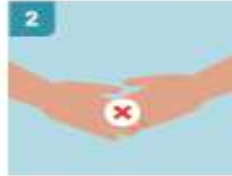
2 EVITAR TODO SALUDO QUE IMPLIQUE CONTACTO FÍSICO