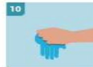
10 INMEDIATAMENTE DESECHE LOS GUANTES EN UN CUBO CERRADO SIN TOCAR EL EXTERIOR