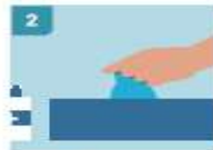
2 DESINFECTARSE LAS MANOS ANTES DE COGER LOS GUANTES