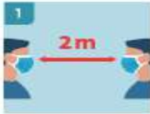
1 MANTENER DISTANCIA PERSONAL EN TODO MOMENTO