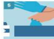
5 RETIRE EL SEGUNDO GUANTE PARA REPETIR EL PROCEDIMIENTO