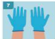
7 YA TIENE COLOCADO AMBOS GUANTES