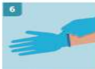
6 ASEGÚRESE SIEMPRE DE TIRAR DESDE LA PARTE DE LA MUÑECA