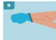
9 PARA RETIRAR EL SEGUNDO GUANTE, DESLICE LOS DEDOS SIN TOCAR EL EXTERIOR