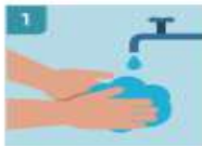
1 LÁVASE LAS MANOS ANTES DE COGER LOS GUANTES