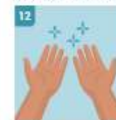
12 SUS MANOS ESTÁN LIMPIAS