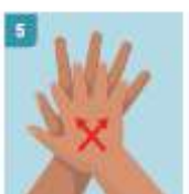
5 FROTE ENTRE SUS DEDOS