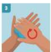
3 FROTAR LAS MANOS PALMA A PALMA