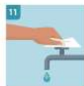
11 USE LA TOALLA PARA CERRAR EL GRIFO