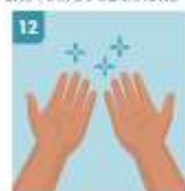
12 SUS MANOS ESTÁN LIMPIAS