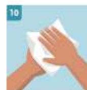
10 SECAR CON UNA TOALLA DESECHABLE