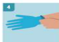
4 ESTÍRE HASTA COLOCAR EL PRIMER GUANTE