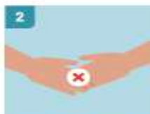
2 EVITAR TODO SALUDO QUE IMPLIQUE CONTACTO FÍSICO