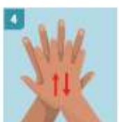
4 ENJABONE BIEN EL DORSO DE SUS MANOS