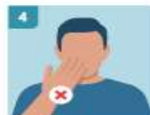
4 EVITAR TOCARSE LA CARA, ESPECIALMENTE OJOS, NARIZ Y BOCA