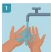
1 MÓJESE LAS MANOS