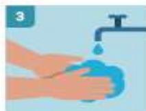
3 LAVADO DE MANOS FRECUENTE