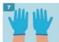
7 YA TIENE COLOCADO AMBOS GUANTES