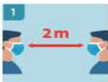
1 MANTENER DISTANCIA PERSONAL EN TODO MOMENTO