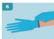
6 ASEGÚRESE SIEMPRE DE TIRAR DESDE LA PARTE DE LA MUÑECA