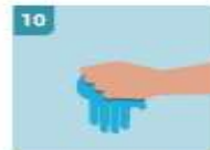
10 INMEDIATAMENTE DESECHE LOS GUANTES EN UN CUBO CERRADO SIN TOCAR EL EXTERIOR