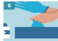
5 RETIRE EL SEGUNDO GUANTE PARA REPETIR EL PROCEDIMIENTO