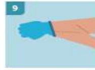
9 PARA RETIRAR EL SEGUNDO GUAANTE, DESLICE LOS DEDOS SIN TOCAR EL EXTERIOR