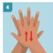
4 ENJABONE BIEN EL DORSO DE SUS MANOS