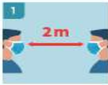
1 MANTENER DISTANCIA PERSONAL EN TODO MOMENTO