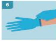
6 ASEGÚRESE SIEMPRE DE TIRAR DESDE LA PARTE DE LA MUÑECA