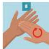
8 LÁVESE LAS VEMAS Y UÑAS DE LOS DEDOS