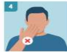
4 EVITAR TOCARSE LA CARA, ESPECIALMENTE OJOS, NARIZ Y BOCA