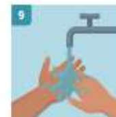
9 ACLARAR LAS MANOS