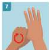
7 FROTE LOS PULGARES CON MOVIMIENTOS ROTATORIOS