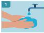
1 LÁVASE LAS MANOS ANTES DE COGER LOS GUAANTES