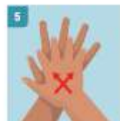
5 FROTE ENTRE SUS DEDOS