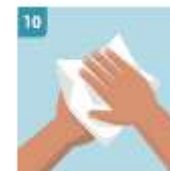
10 SECAR CON UNA TOALLA DESECHABLE