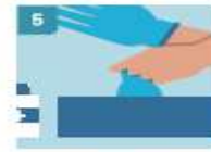
5 RETIRE EL SEGUNDO GUAANTE PARA REPETIR EL PROCEDIMIENTO