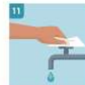
11 USE LA TOALLA PARA CERRAR EL GIRIJO