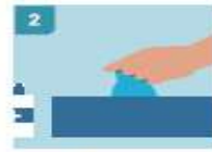
2 DESINFECTARSE LAS MANOS ANTES DE COGER LOS GUAANTES