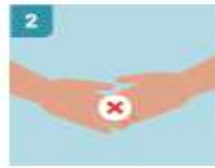
2 EVITAR TODO SALUDO QUE IMPLIQUE CONTACTO FÍSICO