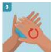
3 FROTAR LAS MANOS PALMA A PALMA