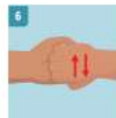
6 ASEGÚRESE DE LIMPIAR BIEN LAS UÑAS FROTANDO CON LAS MANOS CERRADAS