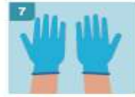
7 YA TIENE COLOCADO AMBOS GUAANTES