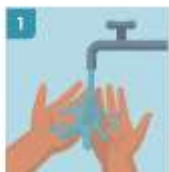
1 MÓJESE LAS MANOS