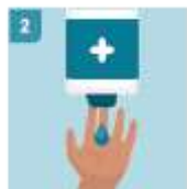
2 UTILICE JABÓN