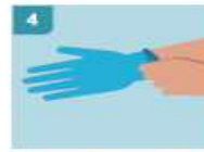
4 ESTIRE HASTA COLOCAR EL PRIMER GUAANTE