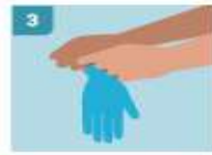
3 TOCAR SOLO LA SUPERFICIE CORRESPONDIENTE A LA MUÑECA