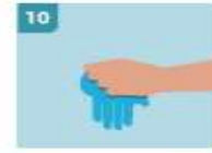
10 INMEDIATAMENTE DESECHE LOS GUAANTES EN UN CUBO CERRADO SIN TOCAR EL EXTERIOR