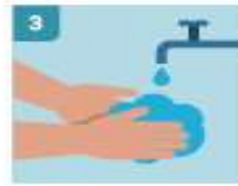
3 LAVADO DE MANOS FRECUENTE