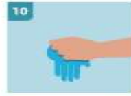
10 INMEDIATAMENTE DESECHE LOS GUAANTES EN UN CUBO CERRADO SIN TOCAR EL EXTERIOR