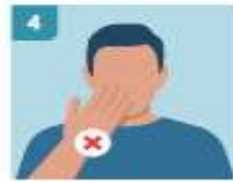
4 EVITAR TOCARSE LA CARA, ESPECIALMENTE OJOS, NARIZ Y BOCA