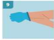
9 PARA RETIRAR EL SEGUNDO GUAANTE, DESLICE LOS DEDOS SIN TOCAR EL EXTERIOR