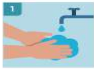
1 LÁVASE LAS MANOS ANTES DE COGER LOS GUAANTES