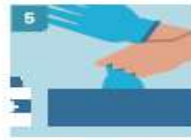
5 RETIRE EL SEGUNDO GUAANTE PARA REPETIR EL PROCEDIMIENTO