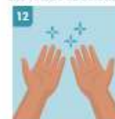
12 SUS MANOS ESTÁN LIMPIAS