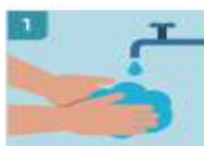
1 LÁVASE LAS MANOS ANTES DE COGER LOS GUANTES