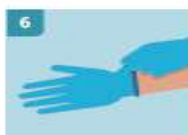
6 ASEGÚRESE SIEMPRE DE TIRAR DESDE LA PARTE DE LA MUÑECA