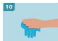
10 INMEDIATAMENTE DESECHE LOS GUANTES EN UN CUBO CERRADO SIN TOCAR EL EXTERIOR