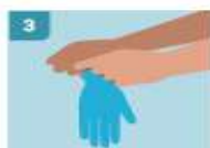
3 TOCAR SOLO LA SUPERFICIE CORRESPONDIENTE A LA MUÑECA