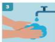
3 LAVADO DE MANOS FRECUENTE