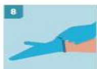
8 PARA RETIRAR LOS GUANTES, PELLÍZQUE POR EL EXTERIOR DEL PRIMER GUANTE