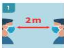
1 MANTENER DISTANCIA PERSONAL EN TODO MOMENTO