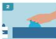
2 DESINFECTARSE LAS MANOS ANTES DE COGER LOS GUANTES