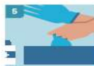
5 RETIRE EL SEGUNDO GUANTE PARA REPETIR EL PROCEDIMIENTO