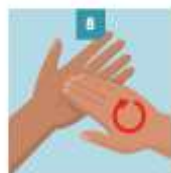
8 LÁVESE LAS VEMAS Y UÑAS DE LOS DEDOS