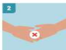
2 EVITAR TODO SALUDO QUE IMPLIQUE CONTACTO FÍSICO