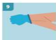
9 PARA RETIRAR EL SEGUNDO GUANTE, DESLICE LOS DEDOS SIN TOCAR EL EXTERIOR