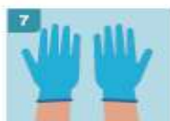
7 YA TIENE COLOCADO AMBOS GUANTES