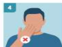
4 EVITAR TOCARSE LA CARA, ESPECIALMENTE OJOS, NARIZ Y BOCA